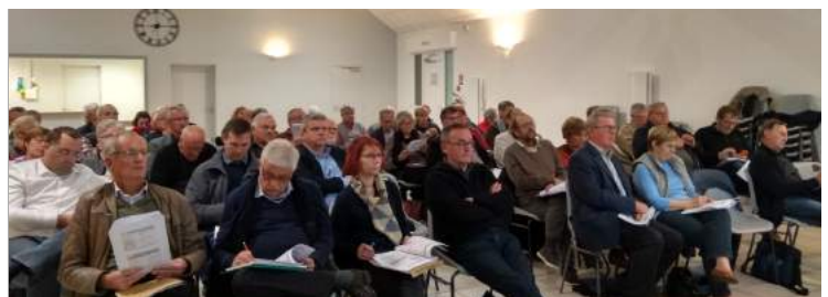
Présentation du diagnostic auprès du comité syndical et du conseil de développement, le 6 novembre 2018

En tant que vice-président en charge du SCoT, je souhaite que tous les acteurs du territoire se mobilisent : les élus, la société civile à travers le conseil de développement et la population. C'est en unissant nos efforts que nous arriverons à promouvoir, préserver et développer tous ensemble le Pays de Bray. Différents moyens sont prévus pour que les élus et les forces vives puissent s'exprimer et faire que le SCoT soit un véritable outil pour le développement brayon.